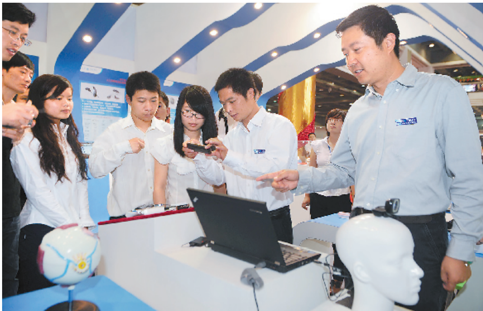
10月10日,浙江省残疾人事业成就展开幕,“诺尔康”展示最新的研发样品——人工视觉。